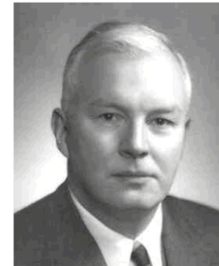
Haskell B. Curry, 1900–1982